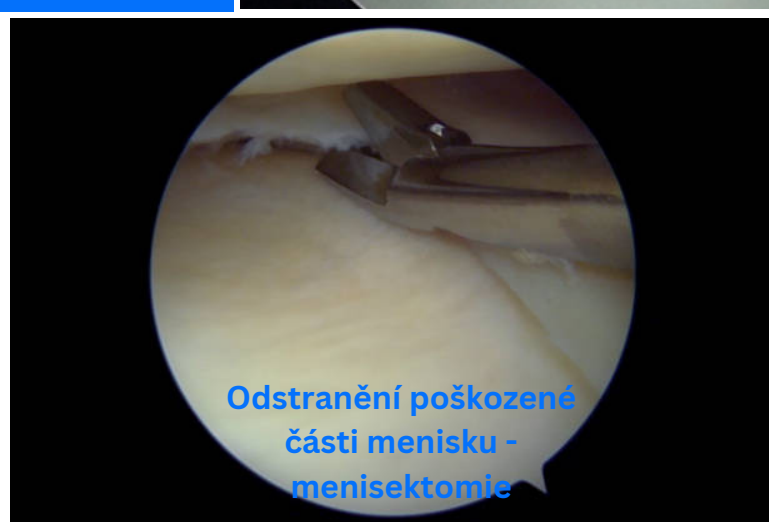
Odstranění poškozené části menisku - menisektomie