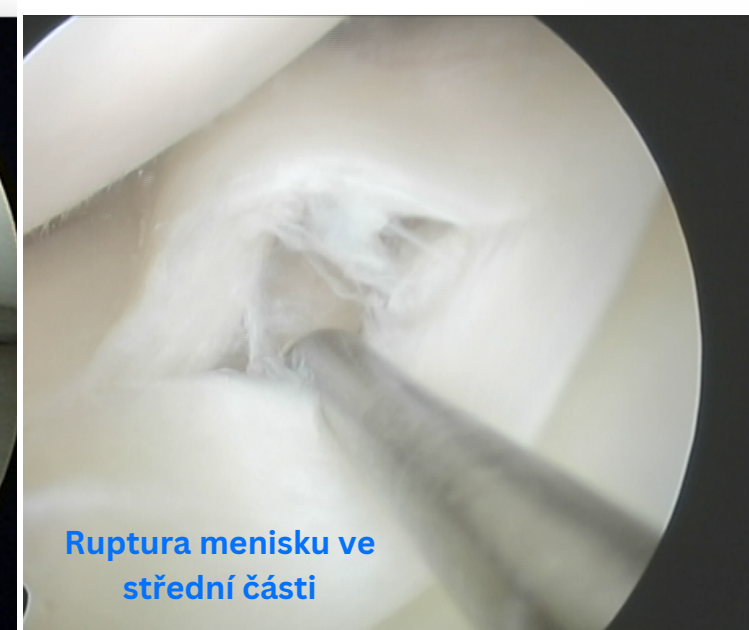
Ruptura menisku ve střední části