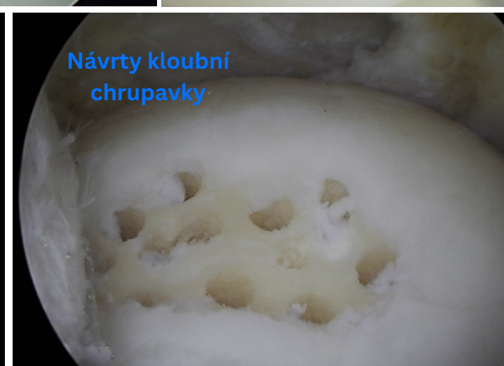
Návrtý kloubní chrupavky