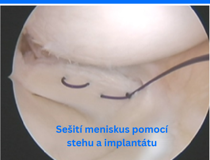
Sešití menisku pomocí stehu a implantátu