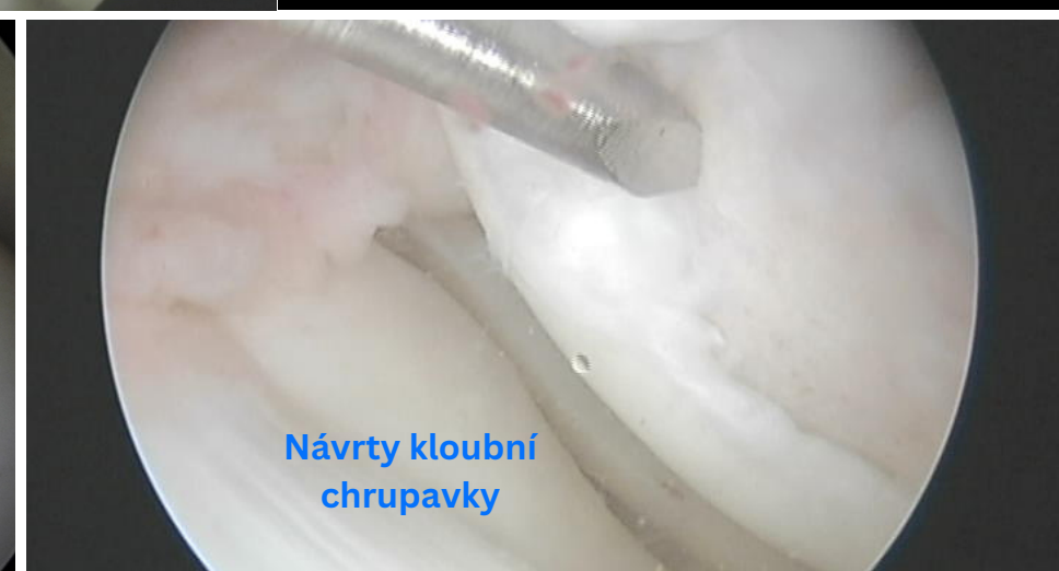
Návrtý kloubní chrupavky