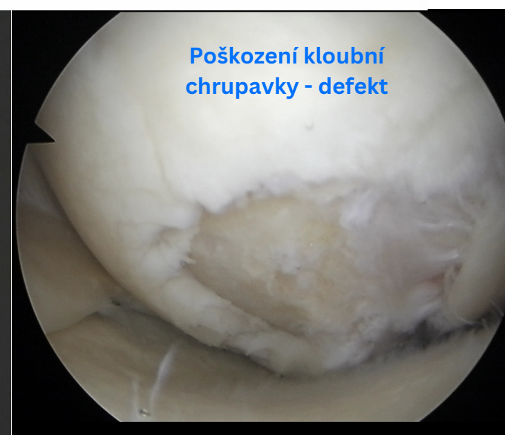
Poškození kloubní chrupavky - defekt